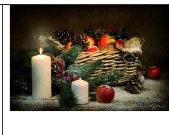
А) Новый год